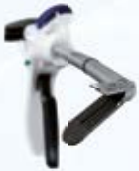
Endo GIA™ Ultra