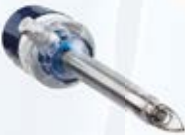
Versaport™ Bladeless Optischer Trokar